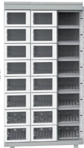
LockBox ohne Kühlung Modell W12

mit praktischer Kühlung für Fleisch, Milch, Gemüse, Obst, Blumen und vieles mehr