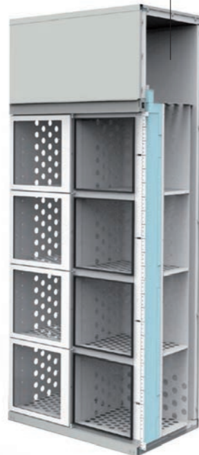
LockBox mit Kühlung Modell W 6/8